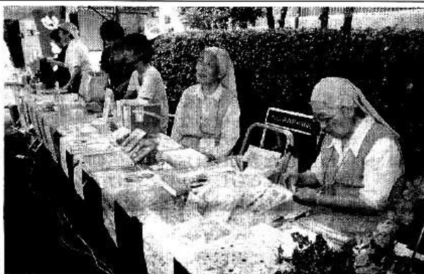
出展ブースにはシスターの姿も

実行委員会では、今後の継続的な定期開催と地方での「いのりフェス」開催を実現させるため、支援を呼びかけている。募金は、同実行委員会（三井住友銀行赤羽支店・普通・3994196）まで。